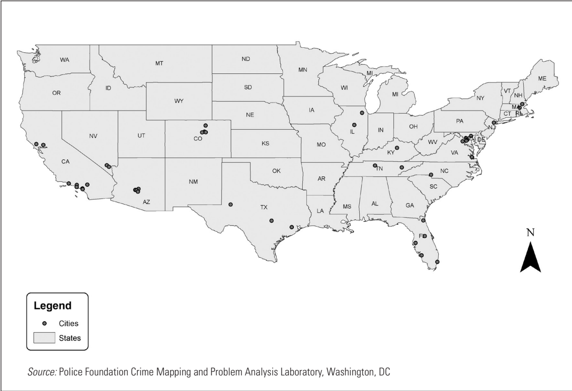
Figure B1. Selected Cities Used for the C.A.A.P. KSAO Analysis